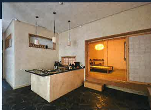
▲レセプションスペース