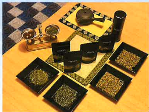
▲種類ごとに包装されたお茶